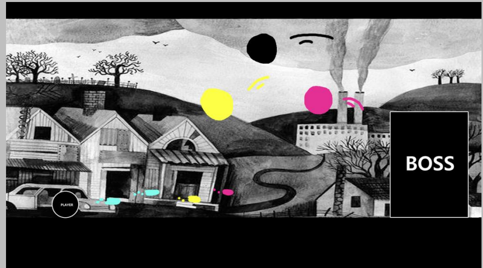
(가상 스크린 샷)