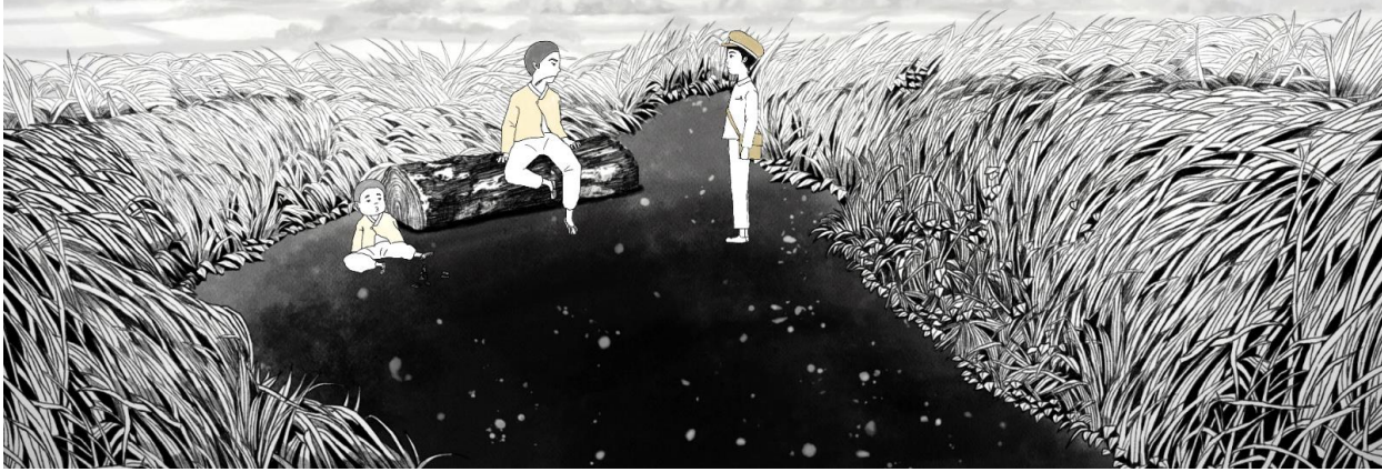
인게임 스크린샷 1 : 동주의 마을 친구인 현호와 현우 형제.