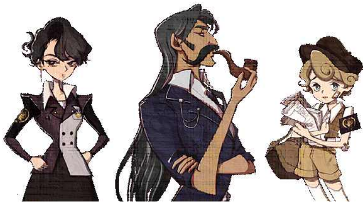
▲ 캐릭터들의 스탠딩 cg 일러스트 그래픽들.

산업혁명 시대, 신문기사를 다루는 게임인 만큼 전체적으로 '신문지에 그려진 종이삽화' 느낌이 나도록 삽화와 일러스트들의 느낌을 조정했습니다. 캐릭터들의 비율 역시 실제와 다르게 각 캐릭터의 성격적 특성을 나타낼 수 있도록 고유의 신체비율을 갖게 과장시켰습니다.