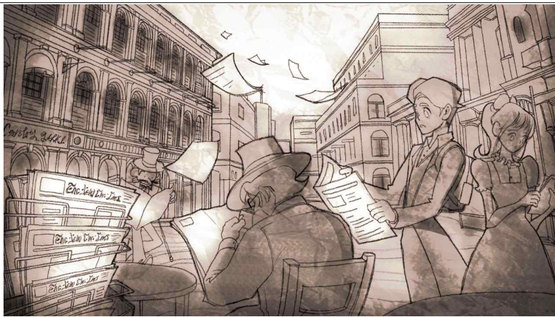
▲ 세피아 톤의 선화로 이루어진 삽화 일러스트 그래픽 배경들.